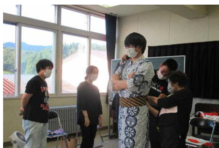
【浴衣着付け講習会】

上記は計画です。今年度は7月の学校祭で浴衣着付けの補助と、9月のマラソン大会の給水支援を実施しました。卒業式に向けて生徒の思い出に残る記念品などを保護者と創意工夫して準備するなどの活動を検討しています。