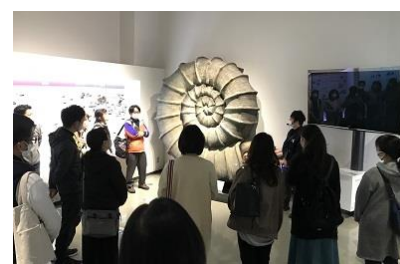
PTA研修会（ジオツアー）