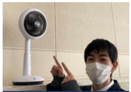
サーキュレーター機能付き扇風機購入

新型コロナウイルス感染拡大防止のため、学校祭をはじめとする学校行事が中止、延期となりました。PTA 活動も総会が紙面審議となり、花壇作りも保護者の参加は見送り、研修も中止となり、活動は縮小を余儀なくされています。