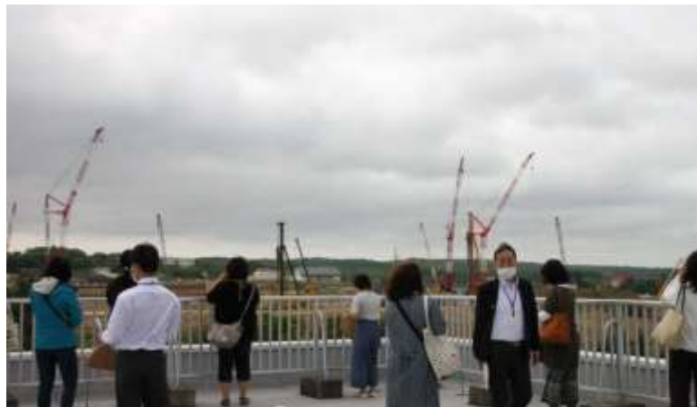
役員理事会議後ボールパーク建設現場視察