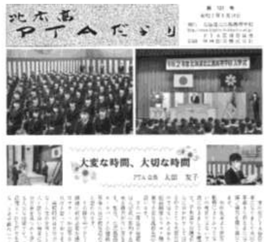
広報委員会 『PTA だより』