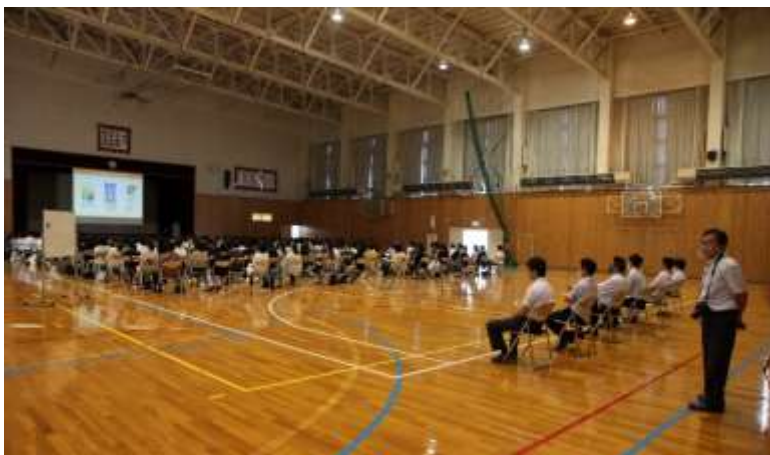
年次進路委員会 『PTA 進路研修会』

昭和 53(1978)年開校（創立 43 年）平成 23(2011)年単位制に移行『進学重視型単位制』 校訓 「自主創造」「誠実信頼」「刻苦試練」 学校教育目標 ○創造的で知性豊かな人間を育てる ○礼儀正しく情操豊かな人間を育てる ○勤労を愛し心身すこやかな人間を育てる