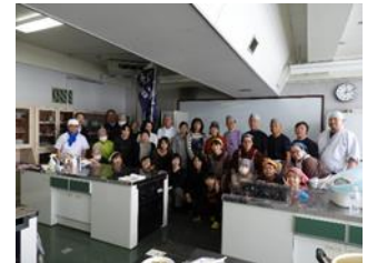
令和元年度PTA視察研修・教養講座の様子