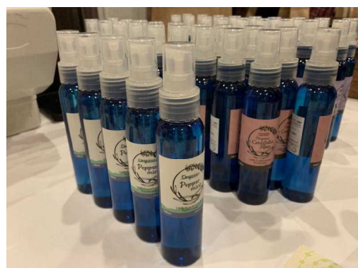
ハーブを使った製品