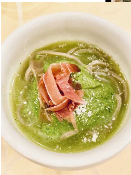
ハーブを使ったパスタです！！