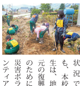
状況でも、本校生は、地元復興のために災害ボランティア

平成28年8月下旬、南富良野町は未曾有の大雨によって町内を流れる空知川が決壊しました。幸いにも本校舎は浸水を免れましたが、町の中心部には氾濫した多量の泥水が流れ込み、一時は350人が孤立する事態となりました。本校もインターシップを中止したりJRが不通となったりして学校行事の見直しを迫られる大きな影響を受けました(現在も東鹿越へ新得の区間は、代行バスによる運行)。しかし、そのような