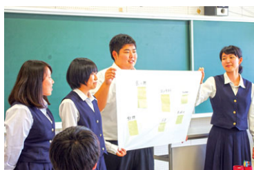
町おこしワークショップ

奥尻島が抱える課題の探求や調査活動を行い、課題解決策を発表し、プレゼンテーション能力を育てます。今年度は、2月に慶應義塾大学大学院システム・デザインマネジメント研究科と共同研究した島民のQOL調査の結果から、いくつかの課題について解決策を提案します。