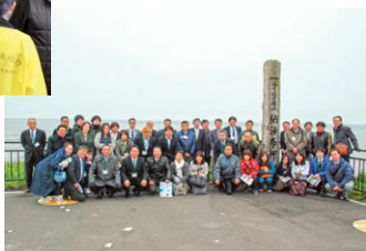
平成29年度第1回研修会 納沙布岬・北方館

今年度は、6月3日(土)に根室高校会議室及び納沙布岬・北方館にて、支部総会と第1回研修会が開催されました。総会では、平成29年度事業計画、会計予算、支部役員の見直し等の議案が承認されま