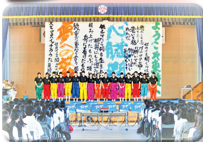
オープンスクール (書道パフォーマンス)