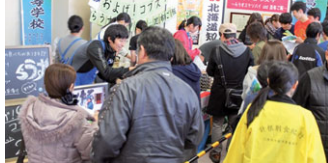
High School fes 2016 in 標津