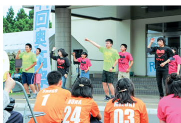
学校祭 (パフォーマンス)

ショップ形式で話し合います。様々な課題に対して、活発に意見交換がなされ、地域創生について学ぶ本校の代表的な教育活動です。島を愛し、島に誇りを持つ持続可能な社会づくりの主体者を育成します。