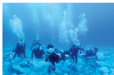
スクーバダイビング

平成7年度からスタートし、23年目を迎えたスクーバダイビングでは、外部インストラクターによる学科講習、実技講習により、Cカードやアドバンスカード等の各種資格を取得することが出来ます。「奥尻ブルー」と言われる美しい奥尻の海の魅力を再発見し、環境保全について考える取組となっています。