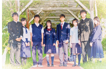
平成28年度入学生よりJ.PRESSの新制服

本校は、昭和54年4月に開校。東区の人口は現在25万人を超え、東雁来地区をはじめ、学校周辺は新興住宅街となっています。またこの地区は地域連合町内会の活動も活発で、PTA・学校・地域と連携し、地域の活性化に積極的に取り組んでいます。