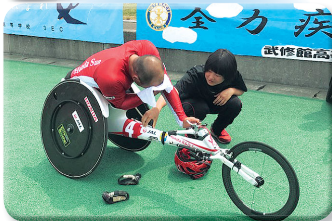
釧路湿原全国車いすマラソン大会奉仕活動