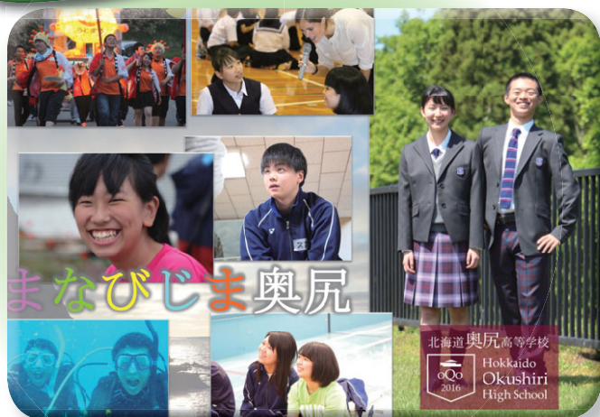
「まなびじま奥尻」で最先端を目指します