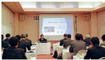
後悔しないように 精一杯毎日を生きているのか

さらには障がいを通じ、まちづくり団体の代表までを務められています。あまりの公職の多さに驚愕致しましたが、強い劣等感に襲われプライドと夢や希望までも奪われた現実、目を背けることなく現実を直視して前向きに生きていく過程の中で、人として、母親として、障がい者として、自分はどうか生きるのか、人として大切なものは何なのかということをお話して頂きました。利己主義が蔓延する現代において、まさに忘れかけていた「人」としての生き方を教わった気がいたしました。