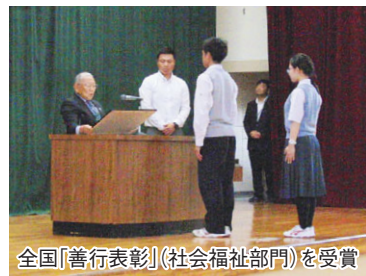
全国「善行表彰」(社会福祉部門)を受賞

平成十六年には、現在の武修館高等学校と校名を変え「愛と奉仕に生きる」(校訓)を実践・リードする