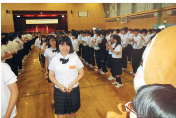
韓国空港高校を迎えての歓迎式

(1) 姉妹校交流 本校では2つの国際科だけでなく、全校で国際交流に取り組んでいます。韓国空港高校と米国ジェームスリバー高校とは姉妹校として、毎年それぞれの訪問団が来訪します。本校からも10月に韓国、11月に米国を訪れ、相互に生徒宅でホームステイし、一緒に学校生