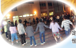
定時制学校祭「鶴翼祭」 恒例フォークダンス