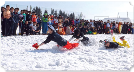
冬季レク (スノーフラッグ)

名物の雪上運動会です。保護者は、代々引き継がれているレシビをもとに豚汁を作り、生徒へ提供して下さいます。冷えた体がポカポカ温まります。