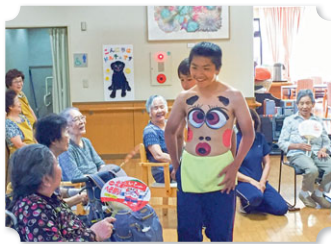
へそ祭り (施設慰問)

◆夏休み 北海へそ祭り 書道部や茶道部のパフォーマンス、吹奏楽局のパレードの他、ラグビー部が施設への慰問を行っています。