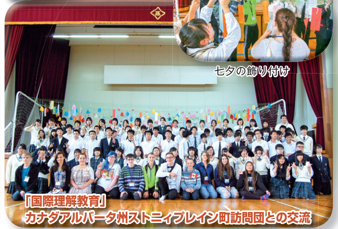
【国際理解教育】 カナダアルバータ州ストニブレイン町訪問団との交流