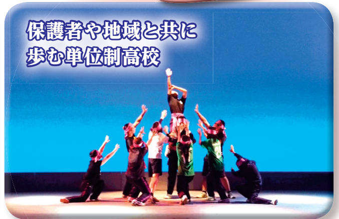
学校設定教科「表現」の授業