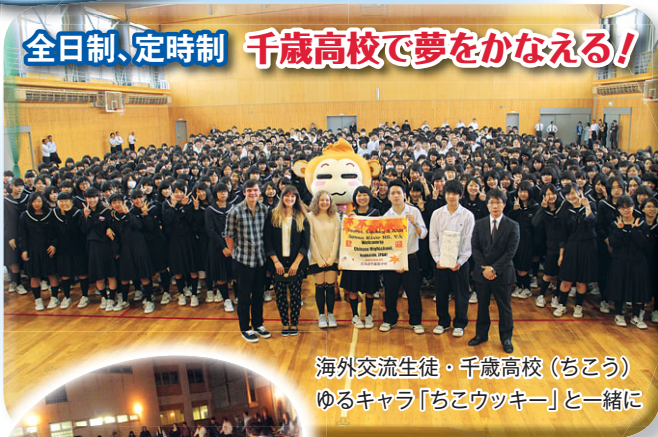
海外交流生徒・千歳高校(ちこう) ゆるキャラ「ちこウッキー」と一緒に