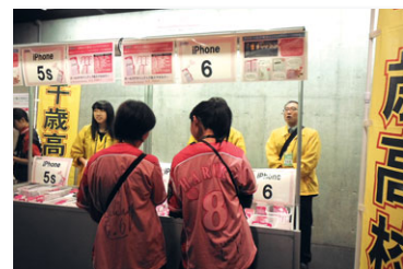
札幌ドームでのスマホカバー販売

地域活性化を目指す千歳バーガー協議会に協力し、国際教養科では外国人観光客にPRするプロジェクトを展開しています。自国と世界の食文化の学習の一環で、千歳の観光促進に一役買っています。