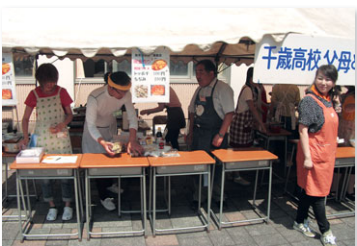
現役PTAとOB・OGによる出店

韓国空港高校との交流では訪問団に加わり、PTA同士の交流会を毎年両国で開催します。また、学校祭では、現役PTAのカレーライスに加え、PTA・OB・OGが韓国料理を提供する店を出し、生徒や保護者、地域の方に、毎年大人気です。